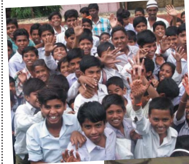
(좌)우리 교회 선교사역지인 인도 어린이들 (야) 케냐의 웬다니 하미니 음악학교

세계 선교에 나선 선교사님들께서 주님의 지상 대 명령인 '땅 끝까지 이르러 내 증인이 되라' 하신 말씀대로 온갖 역경을 헤치고 오직 주님의 말씀에 순종하며 이국땅 저 멀리서 많은 민족들을 위해 영혼 구원하시는 그들의 수고와 땀방울을 다 보고 알기에 우리는 보내는 선교사로서 사랑과 온 마음을 담아 기도와 물질 후원이라는 섬기는 손길을 조금이라도 함께 나누며 다 행복해질 때, 그 이후는 하나님이 축복을 물 붓듯이 부어주시고 늘 행통의 자리로 인도해주실 줄 믿습니다.