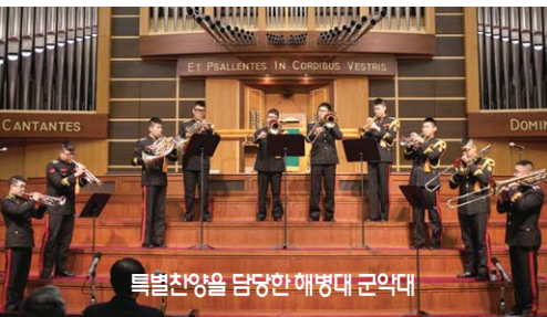
특별찬양을 담당한 해병대 군악대