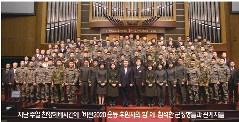
지난 주일 찬양예배시간에 '비전2020 운동 후원자의 밤'에 참석한 군장병들과 관계자들

* 후원서는 1층과 8층에 후원서가 비치되어 있습니다. 많은 후원 부탁드립니다.