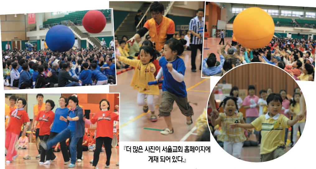
『더 많은 사진이 서울교회 홈페이지에 게재 되어 있다.』