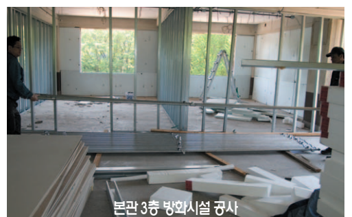
본관 3층 방화시설 공사