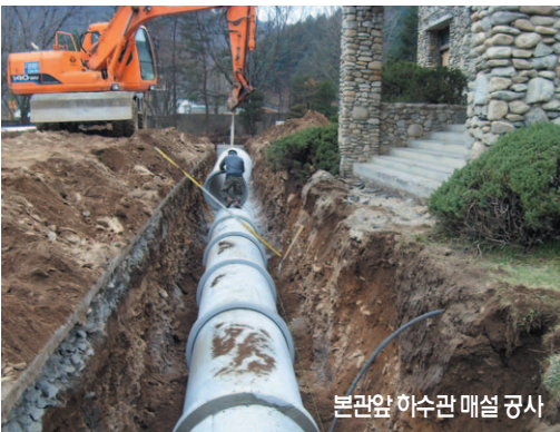
본관앞 하수관 매설 공사

푸르른 5월의 신록에 둘러싸인 아가페 타운이 아름다운 모습으로 거듭나기 위해 안팎 다듬기에 한창이다.