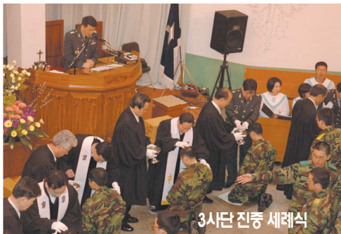
3사단 진중 세례식