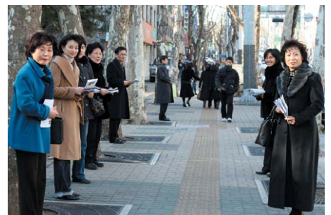
▲교회 앞에서 실습 중인 32기 전도학교 수료자들

지난 1월13일부터 12주간 실시된 32기 전도학교 수료식이 오늘 찬양예배시간에 거행된다. 서울교회 전도학교는 교실강의 후에 교회 인근에서 노방전도를 실습하고, 매일 매일의 주간학습을 통하여 하나님 나라 확장의 주역으로 세워지는 효과적인 훈련과정이다. 33기에는 기존 주말반에 더하여 수요야간반이 신설되며 6월 1일 개강한다. 많은 성도들의 참여를 기다린다. 수료자명단은 다음과 같다.