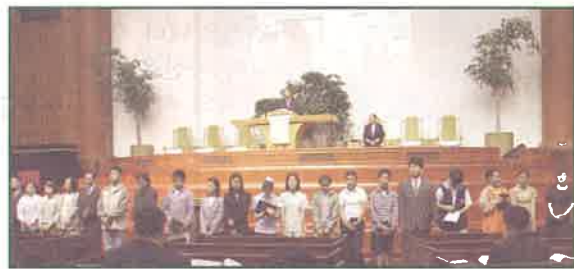
③ 중등부 헌신예배 - 젊은 날에 주를 알고 그를 경외하는 청소년이 되기를...