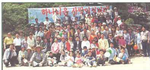
②새 가족부 야외예배 - 양적, 질적 성장이 보이는 군요.