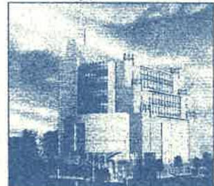
▲ 2000. 12. 25 완공될 교회

서울교회 새성전 건축이 전적으로 하나님의 은혜로 이루어져 가고 있음을 누구도 부인하지 못하도록 하나님께서는 계속적으로 온 성도의 기도와 관심을 요구하셨다.