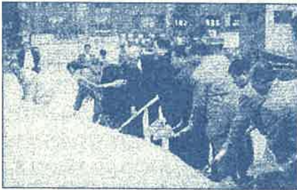
▲ 1998. 10. 10 일 시작예배