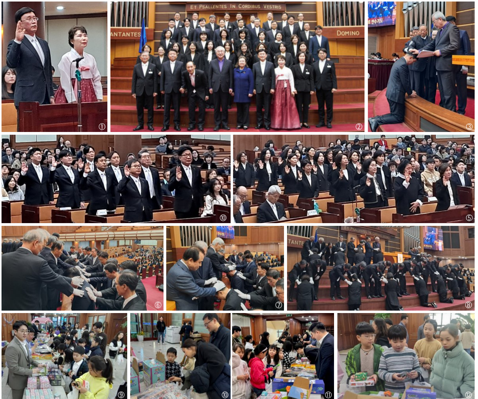
①-⑧ : 17대 장로 · 16대 안수집사 · 15대 권사 임직식, ⑨-⑫ 교회 생일 축하 교회학교 연합 달란트 시장