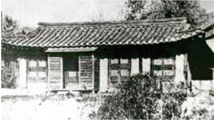
최초의 새문안교회(언더우드 선교사의 사택)