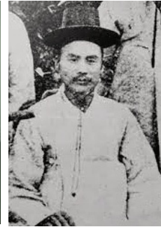
제주도 최초 선교사 이기풍 목사