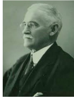
게일(James S. Gale) 선교사