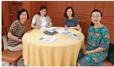
7월 9일 주일 마리아전도회