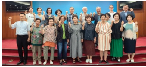
7월 8일 토요일 70인전도대와 기도팀의 단합대회로 모임을 갖고 1시부터 토요 노방전도를 했습니다.