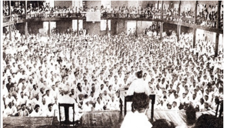
평양 장대현교회 예배 장면

교회사에는 대부흥운동이라 명명되는 사건들이 존재한다. 18세기 말부터 20세기 초까지 굵직한 대부흥운동이 전세계에서 발생했다. 영국, 미국, 웨일즈, 아일랜드, 인도, 한국, 호주, 만주 등지에서 부흥운동이 일어났고 이 중 미국과 웨일즈, 한국의 사례를 대부흥이라 부른다. 우리는 흔히 부흥을 교세의 성장으로 생각하기 쉽다. 하지만 대부흥 사례들의 공통적인 특징을 꼽으면 교세의 성장은 중요한 부분이 아니다. 대부흥의 핵심은 하나님과 인간의 관계 회복에 있다. 따라서 대부흥운동의 두드러지는 특징은 통렬한 죄의 고백, 감정적인 고양, 도덕성의 회복, 영적 각성 등이라 할 수 있다. 교세의 성장은 교회의 변화에 따른 부수적인 일이다.