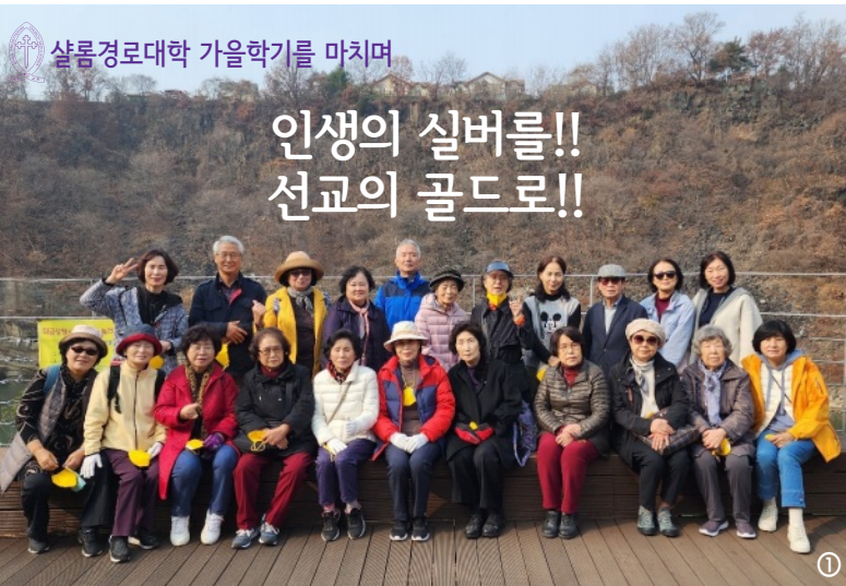
살롬경로대학 가을학기를 마치며

열정으로 교육을 맡아주신 목사님, 전도사님들께 감사드리며 우리의 주관자이신 하나님께 감사와 영광 올려 드립니다.