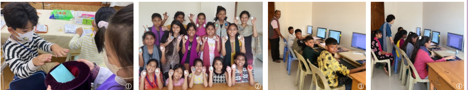
① 유년부 어린이들이 정성껏 헌금하였습니다. ② 방글라데시 소망 호스텔 어린이들 ③, ④ 방글라데시 소망호스텔에 유년부 어린이들이 기증한 컴퓨터가 잘 도착했습니다.

방글라데시의 아이들을 위해 단순히 일회성 도움으로 끝나는 것이 아닌 지속적인 관심과 후원으로 내리사랑의 의미와 뜻을 유년부에서 이어가길 소망합니다.