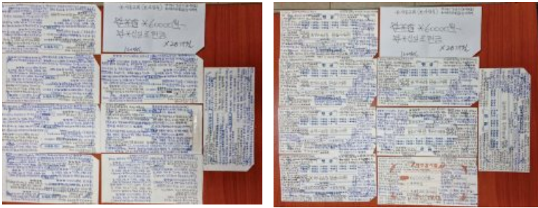
지난 주일 유지성 성도가 드린 26개월간의 십일조 봉투

지난 주일, 우리 교회 사랑부 유지성 성도가 코로나19 사태로 인해 교회 출석하지 못한 지난 26개월 동안의 십일조를 모아서 한 번에 드렸습니다.