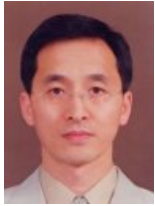
채교전 집사 (2022 흥해작전 예배분과장)

"오직 성령이 너희에게 임하시면 너희가 권능을 받고 예루살렘과 온 유대와 사마리아와 땅 끝까지 이르러 내 증인이 되리라 (사도 행전 1:8)"