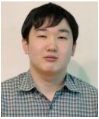
유지성 성도 (사랑부)