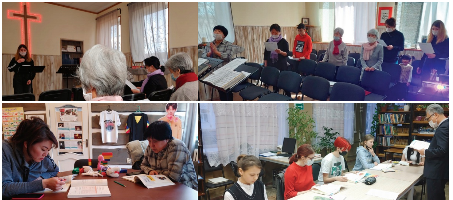
윗 줄 : 러시아 교인들과 예배드리는 모습 아랫 줄 : 러시아인을 대상으로 하는 한글학교