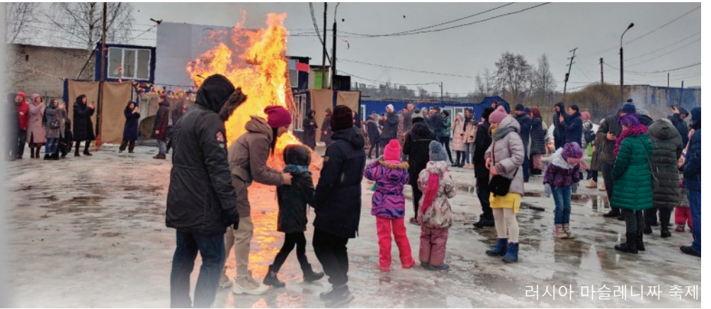
러시아 마슬레니짜 축제

고통의 긴 겨울을 보내고 새 생명이 싹트는 희망의 봄을 맞이하기를 기도합니다